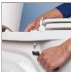
Sistema de ajuste perfecto Permajuste™