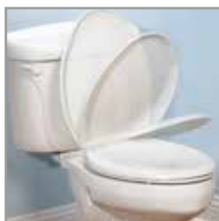
Sistema de Acción de Cierre Lento