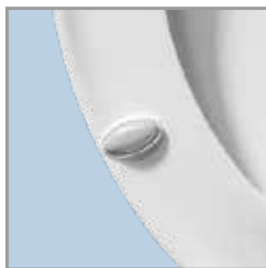
Topes con súper agarre