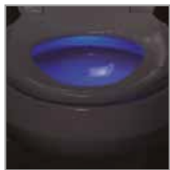
Luz nocturna incluida