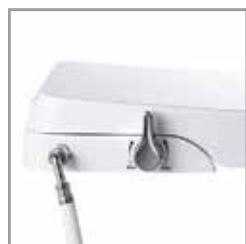
Presión de agua ajustable