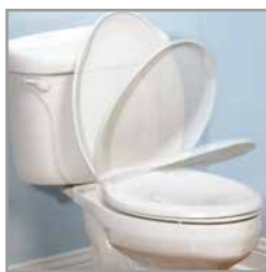
Acción de Cierre Lento en tapa y anillo.